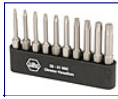
10 Pc. Torx Power Bit Set 6, 7, 8, 9, 10, 15, 20, 25, 30, 40